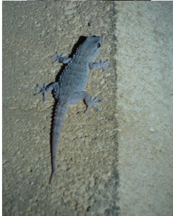
Tarentola mauritanica - Juvénile - Lot-et-Garonne - Agen, août 2022