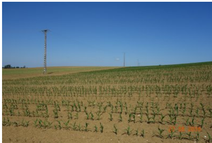
Paysage dans les environs de 47-Brazalem, mai 2019