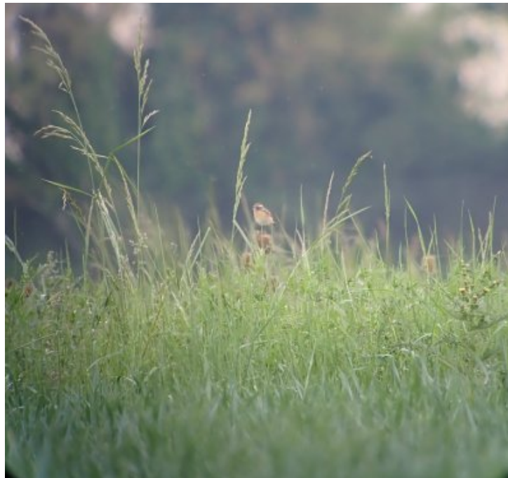
Photographie : Tringa totanus – Chevalier gambette – Halte migratoire dans un champ de maïs – 47 LAYRAC – Mai 2025