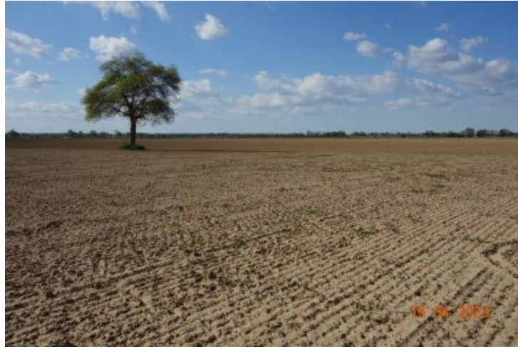
La Garonne à 47- Saint Hilaire de Lusignan, avril 2022