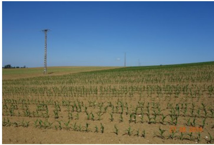
Paysage dans les environs de 47-Brazalem, mai 2019